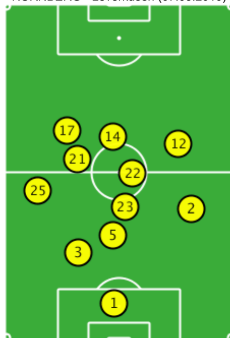
NÜRNBERG - Leverkusen (07.03.2010)